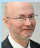
Hermann-Josef Broß, Finanzministerium Nordrhein-Westfalen