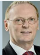
Jochen Homann Präsident Bundesnetzagentur