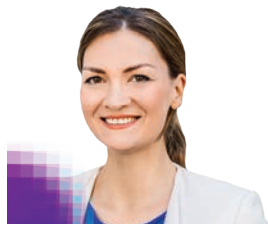
Judith Gerlach MdL Bayerische Staatsministerin für Digitales