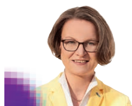
Ina Scharrenbach MdL Ministerin für Kommunales, Bau und Digitalisierung NRW