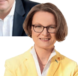
Ina Scharrenbach MdL Digitalministerin Nordrhein-Westfalen