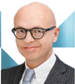
VORSITZ | 10. DEZEMBER 2020

Beteiligen Sie sich aktiv am vergaberechtlichen Austausch und knüpfen Sie am 15. Deutschen Vergaberechtstag wertvolle neue Kontakte.