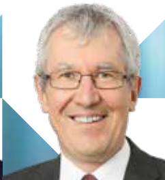
Norbert Portz, Deutscher Städte- und Gemeindebund