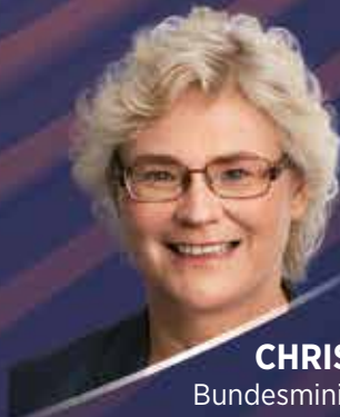
CHRISTINE LAMBRECHT Bundesministerium der Finanzen