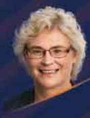
Christine Lambrecht Parlamentarische Staatssekretärin beim Bundesministerium der Finanzen