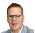
Tino Sorge MdB, CDU