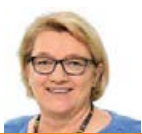
Kordula Schulz-Asche MdB, Die Grünen