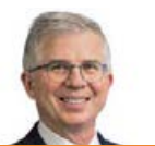
Prof. Dr. Andrew Ullmann MdB, FDP